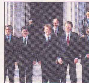
3/12/92 Με τους νέους Υφυπουργούς