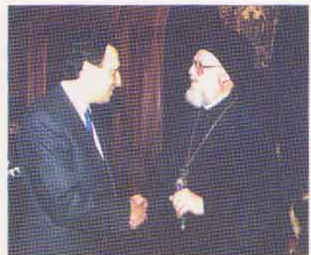
ΚΩΝΣΤΑΝΤΙΝΟΥΠΟΛΗ: Με τον Πατριάρχη κ. Βαρθολομαίο