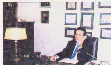
ΘΗΒΑ: στο γραφείο του