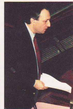
ΒΟΥΛΗ: Υφυπουργός Γεωργίας στον Κοινοβουλευτικό έλεγχο