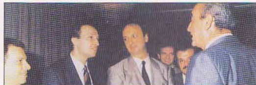
ΑΘΗΝΑ: με τον Κώστα Μητσοτάκη και νέους Βουλευτές

• Εισηγητής της πλειοψηφίας σε διάφορα νομοσχέδια, οικονομικού κυρίως περιεχομένου. Ομιλήτης στη συζήτηση όλων των Κρατικών Προϋπολογισμών, καθώς και πολλών νομοσχεδίων. Κατέθεσε και συζητήσε στη Βουλή ερωτήσεις για γενικότερα θέματα καθώς και ειδικότερα θέματα που ενδιαφέρουν τη Βοιωτία. Υπέβαλε προτάσεις για τροποποίηση του Κανονισμού της Βουλής.