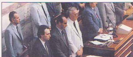
ΒΟΥΛΗ: η πρώτη ορκωμοσία