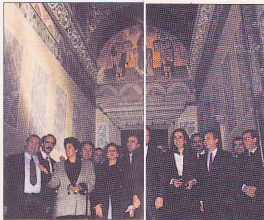
ΚΩΝΣΤΑΝΤΙΝΟΥΠΟΛΗ: Με βουλευτές της Ν.Δ. κλιμακίου στην Αγ. Σοφία.