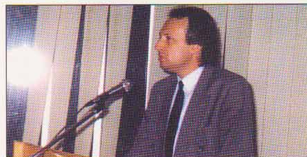
ΘΕΣΣΑΛΟΝΙΚΗ: σε μία διάλεξη