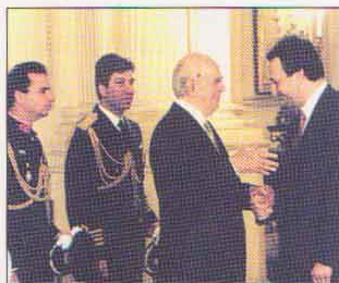
ΠΡΟΕΔΡΙΚΟ ΜΕΓΑΡΟ: Με τον αείμνηστο Πρόεδρο της Δημοκρατίας Κωνσταντίνο Καραμανλή.