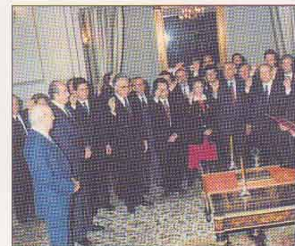
Ορκωμοσία ως Υφυπουργός