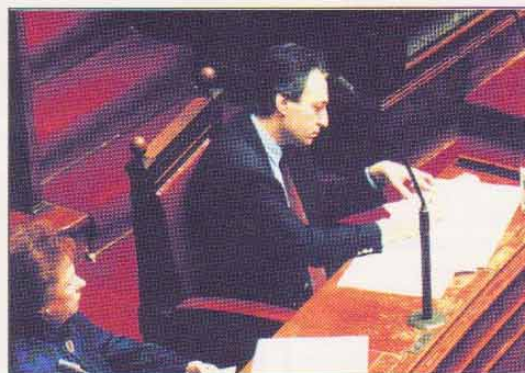
ΒΟΥΛΗ : Στα Κυβερνητικά έδρανα

• Ο νεότερος Υφυπουργός στην ιστορία της Βοιωτίας.