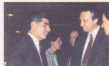
ΒΟΣΤΩΝΗ: με τον Μάικ Δουκάκη