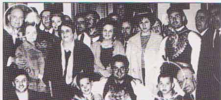
ΘΗΒΑ: μικρός ντυμένος βλάχος τις απόκριες με τον πατέρα του και το βείο του Αριστείδη Μπασιακού που υπηρέτησε τον τόπο ως Βουλευτής και Υπουργός