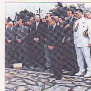
ΚΙΛΕΛΛΕΡ: Με τον Πρόεδρο της Δημοκρατίας κ. Κωστή Στεφανόπουλο ως εκπρόσωπο του Προέδρου της ΝΔ κ. Κώστα Καραμανλή στην τελετή.