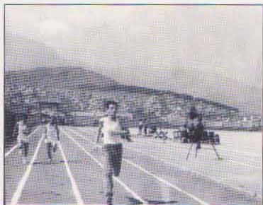
ΛΕΙΒΑΔΙΑ: σε περιφερειακούς αγώνες