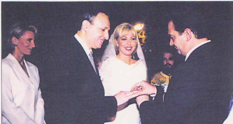
ΘΗΒΑ, Άγιος Ιωάννης Καλοκτένης: Ο γάμος του με τη Νομική Σύμβουλο του Δήμου Ψυχικού Βικεντία Συροπούλου (Οκτώβριος 1999) και η βάπτισμα του γιού του Αθανάσιου - Αριστείδη (Ιούνιος 2002), με τους κουμπάρους τους Κώστα και Νατάσσα Καραμανλή, παρουσία του συνόλου σχεδόν των βουλευτών της Νέας Δημοκρατίας και χιλιάδων φίλων τους. Ευλόγησαν τα μυστήρια οι Σεβ. Μητροπολίτες κκ Ιερώνυμος και Ιγνάτιος.