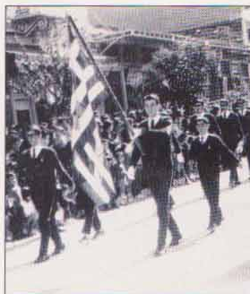
ΘΗΒΑ: σημαιοφόρος στην ΣΤ' τάξη του γυμνασίου στην παρέλαση.