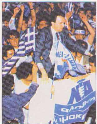
ΘΗΒΑ: μετά από προεκλογική συγκέντρωση.