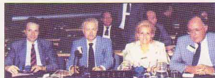
ΛΟΝΔΙΝΟ: στη Διακοινοβουλευτική Διάσκεψη