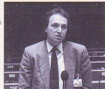
ΣΤΡΑΣΒΟΥΡΓΟ: ομιλήτης στο Συμβούλιο της Ευρώπης