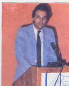
ΘΕΣΣΑΛΟΝΙΚΗ: μιλώντας στο 11ο Συνέδριο Δικηγορικών Συλλόγων,