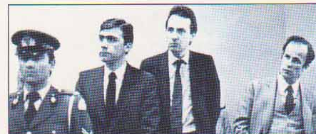
ΑΘΗΝΑ: υπεράσπιση στο Εφετείο.